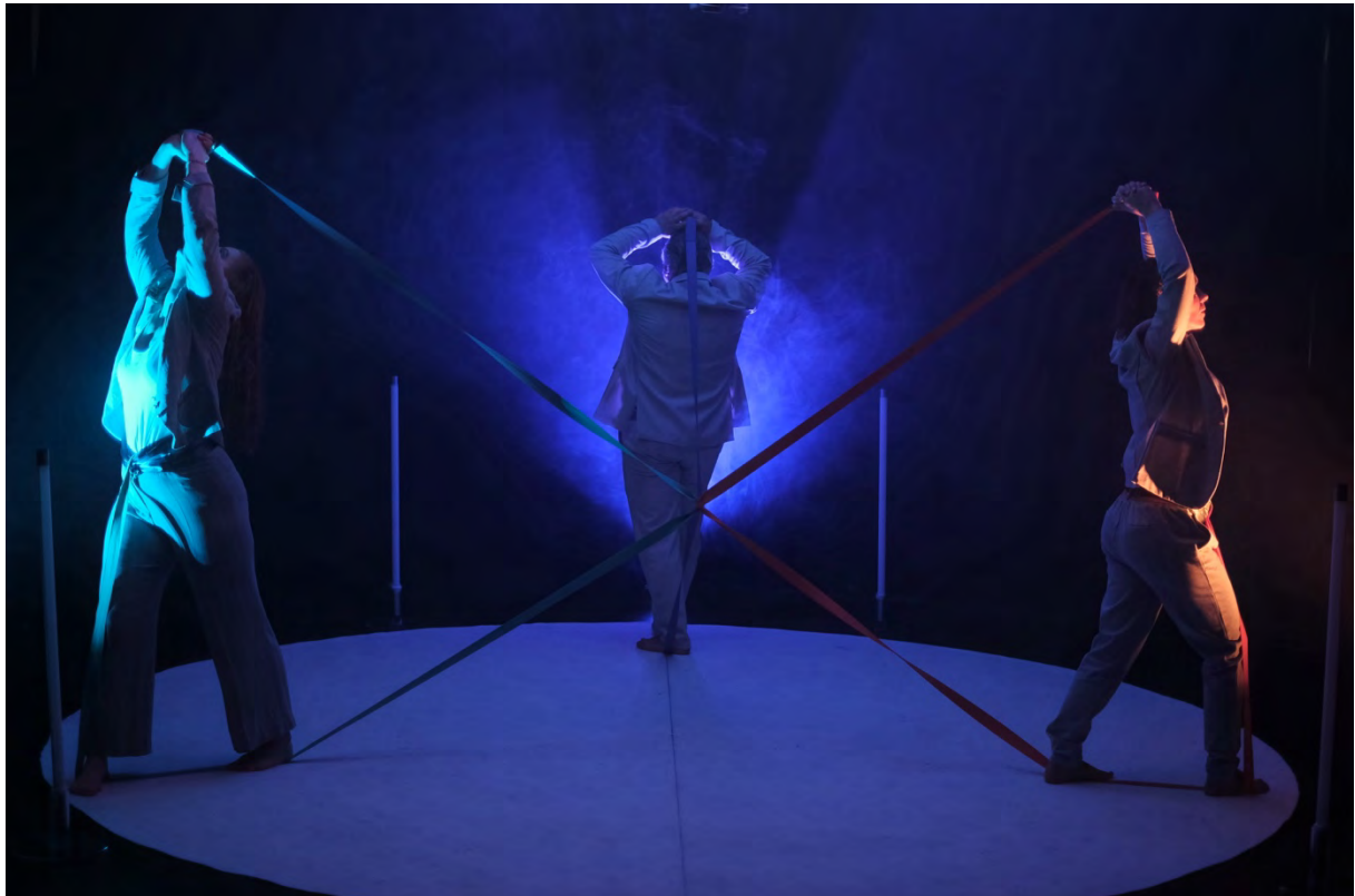
Das Ende des Kreises

Die Inszenierung verbindet individuelle Biografien mit gesellschaftlichen Fragestellungen nach Sichtbarkeit und Verantwortung. Die Vorstellungen wurden durch eine Kooperation mit dem Berliner Krisendienst und Publikumsgespräche abgerundet. So konnte eine direkte Rückkopplung in das alltägliche Leben der Zuschauenden stattfinden. Beeindruckend war die außerordentliche Resonanz: „Ihr leistet eine unglaubliche Arbeit als Sprachrohr für alle, dies aus den unterschiedlichsten Gründen nicht schaffen ihren Angehörigen zu erklären, was in ihnen vor sich geht. Das Stück hat mir Kraft gegeben weiterzumachen, die Situationen nicht persönlich zu nehmen und vor allem, Hilfe zu holen!“ (Rückmeldung einer Zuschauerin)