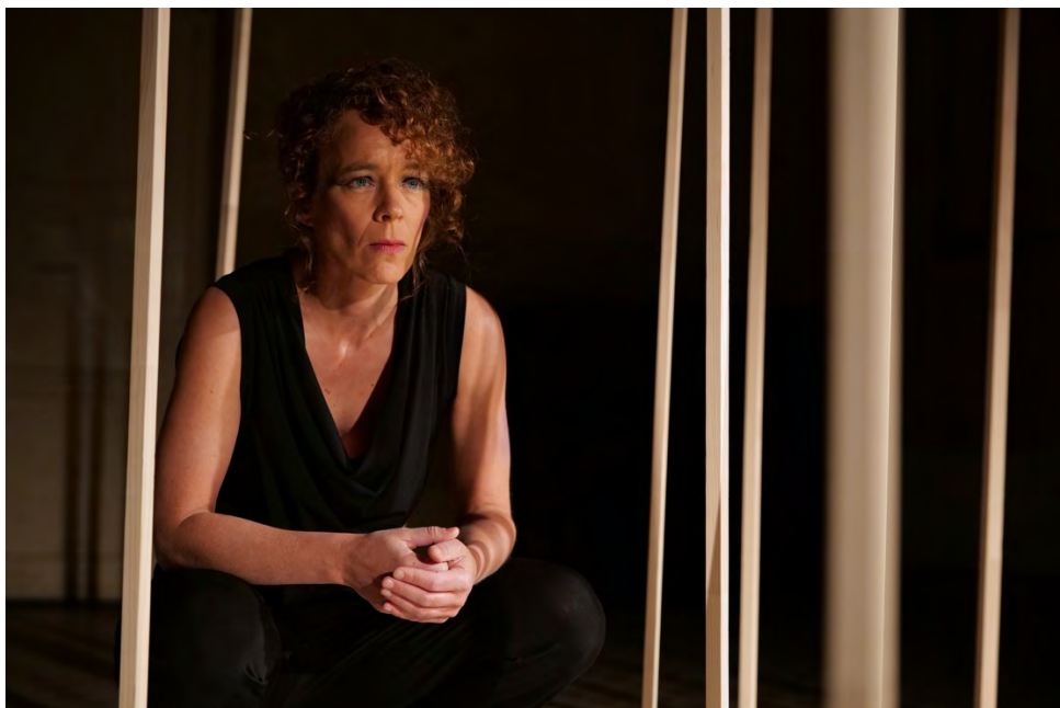
christa:kassandra

In dem Abend nach Christa Wolfs Kassandra und Voraussetzungen einer Erzählung: Kassandra stellen wir die Protagonistin ihrer Autorin gegenüber und schaffen den Bezug zum Heute. Kassandra als eine Figur, die mit unaufhörlichen Wahrheiten konfrontiert. In der Überwindung ihrer Ängste und im schonungslosen Blick auf ihr Leben deckt sie das Gefühl der Ohnmacht gegenüber ihrer Zeit auf. So wie Christa Wolf. Ihre Texte beschäftigen mich seit langem – wir fokussierten uns in der Recherche auf ihre genaue Zeitanalyse, den differenzierten Blick, die Einblicke in das Alltägliche und die unbedingte Aktualität ihres Werks.