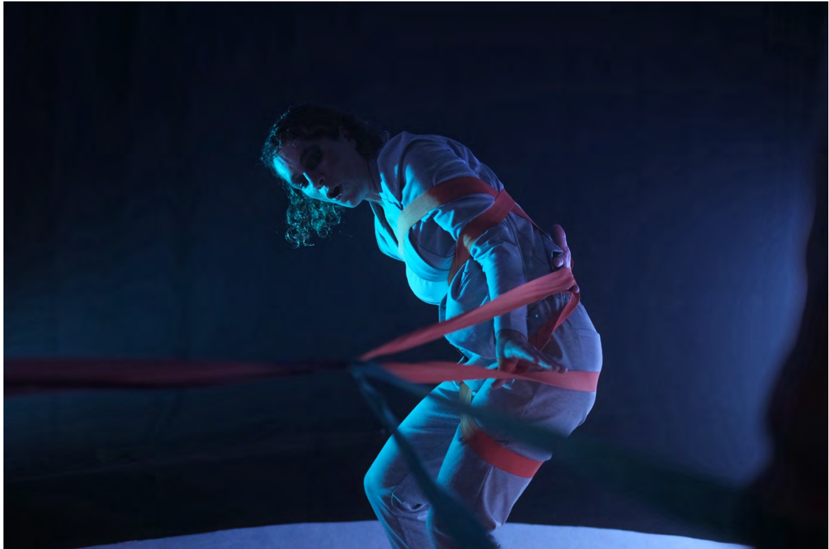
Das Ende des Kreises

Gefördert durch die Heidehof Stiftung GmbH. In Kooperation mit Alte Möbelfabrik e.V.